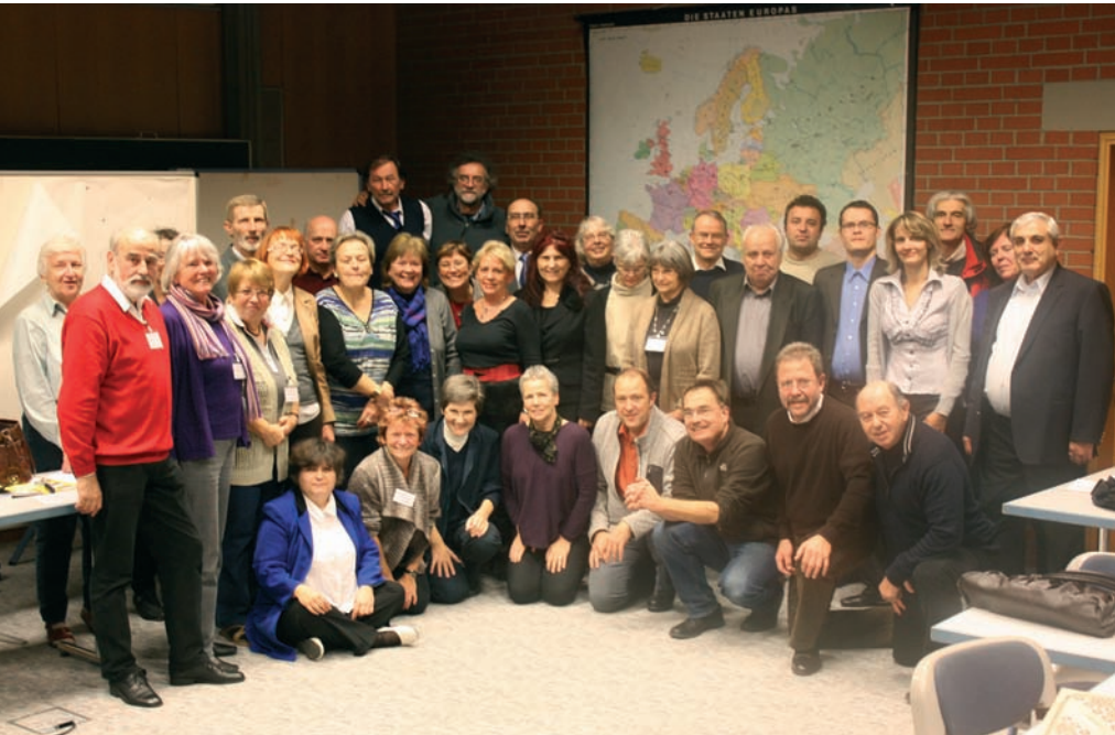
Final Meeting of DANET, Wiesneck, November 2011