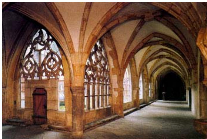
Kružbová okna v křížové chodbě Tracery windows in the cloister

Chór kostela má charakteristickou vznosnou konstrukci s vysokými opěrnými pilíři. Na hřebenu strmé střechy má malou vížku, tzv. sanktusník, typický pro klášterní kostely, jimž řádová pravidla nedovolovala stavět vysoké věže. V prostoru za barokním portálem jsou náhrobní kameny ze 14.-18. století. Původně byly v podlaze chrámu a na nynější místo byly přeneseny v roce 1904.