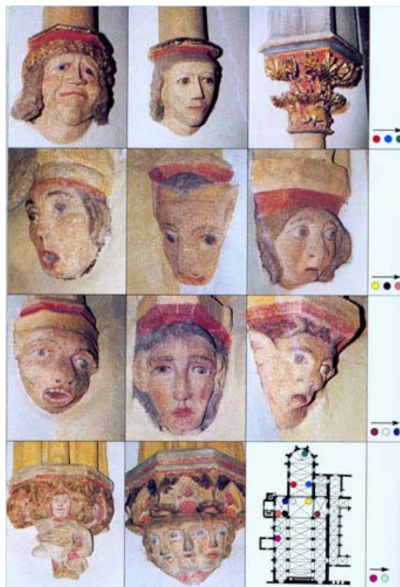
Klenební konzoly (1279–1300) Vaulting brackets (around 1270–1300)

Hlavní loď a postranní jsou především barokní. Vyřezávané barokní lavice, secesní lustry, reliéfy a nástěnné malby je prostě dobré vidět.