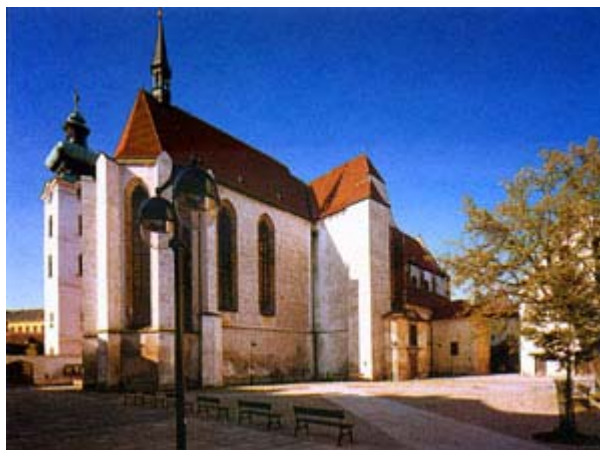
Pohled na kostel přes Piaristické náměstí View of the church across the square

Chrám kostela je utvářen jako bazilikální trojlodí. Boční loď je zapřena opěrnými pilíři a členěna okny, jejichž dnešní podoba je výsledkem barokní úpravy z poloviny 17.století. Okna byla původně štíhlejší s lomenými oblouky a kamennou kružbou. Druhé pole severní lodi je otevřeno malým novogotickým portálem z počátku