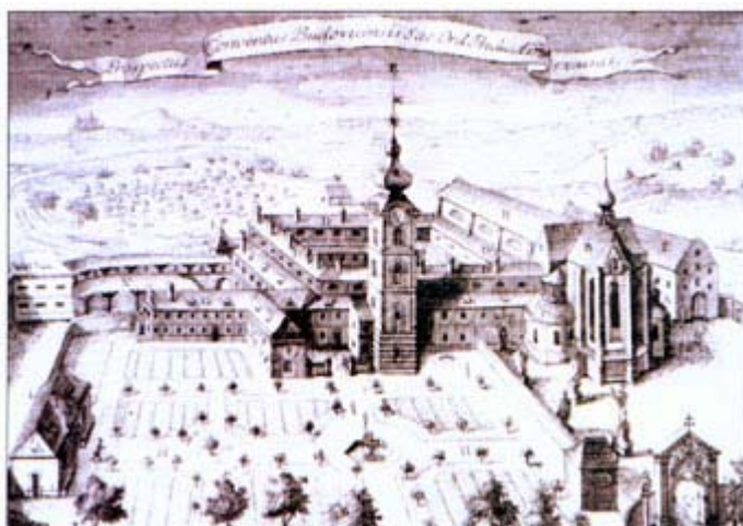
Klášterní kostel Obětování Panny Marie Presentation Virgin Conventual Church

Klášter a kostel Obětování Panny Marie je nejcennější uměleckohistorickou památkou v Českých Budějovicích. Byl založen současně s městem v roce 1265 a budován po dobu několika desetiletí. Při jeho výstavbě došlo opakovaně ke změně původního plánu a i později v průběhu dalších století byl stavebně upravován. Vývoj zaznamenalo i