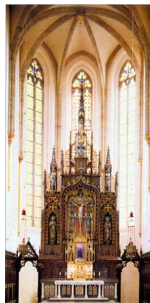
Kněžiště s novogotickým oltářem View to the presbytery with the neo-Gothic

Madona s dítětem, klečící donátor, sv. Dominik a dvě