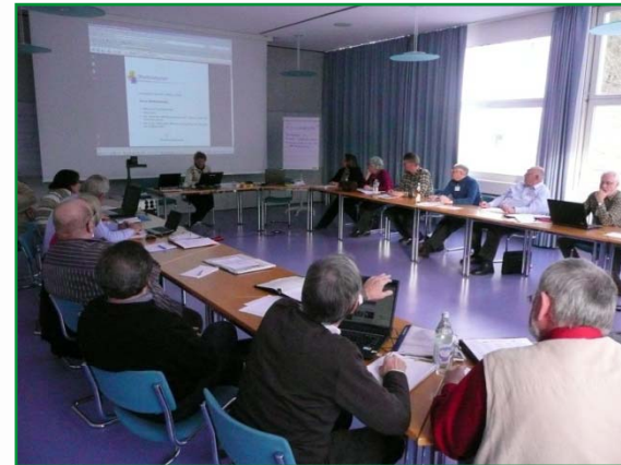
Seminar in Bad Urach, Februar 2010