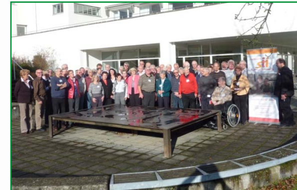
Seminar in Bad Urach, November 2009

Rahmen: zweistufiges Qualifizierungskonzept (Grundqualifizierung sowie Erstellung des weiteren Konzepts und Erprobung gemeinsam mit den SIH-Trainer/-innen)