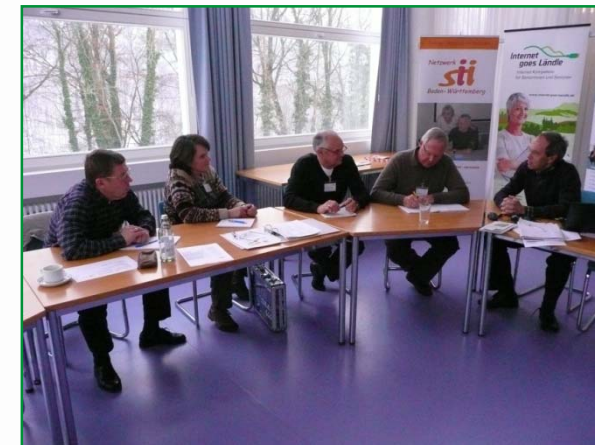
Seminar in Bad Urach, Februar 2010