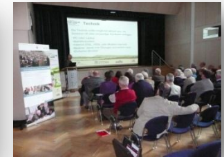
Regionaltag Stockach, Mai'10