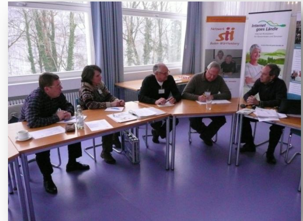
Seminar in Bad Urach, Februar 2010