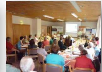
Regionaltage in Dürmentingen, Mai'10, und Crailsheim, Juni'10