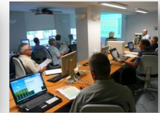
Seminare in Bad Urach, Februar und Juli 2010