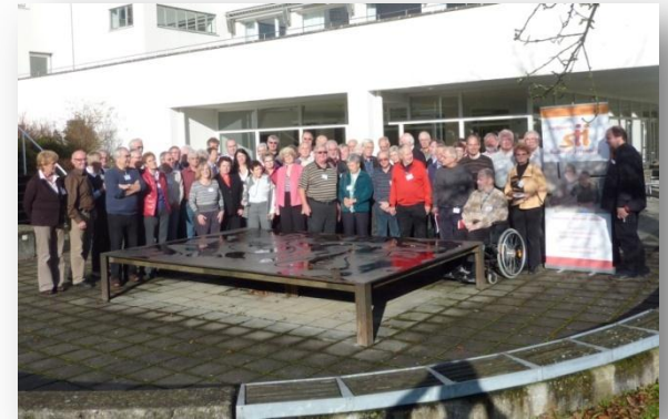
Seminar in Bad Urach, November 2009

2-stufiges Qualifizierungskonzept (Grundqualifizierung + Erstellung des weiteren Konzepts sowie Erprobung gemeinsam mit SIH-Trainer/-innen)