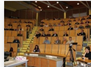
Auftakt in Ulm, März'10