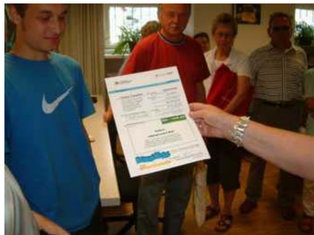
... z. T. mit Junioren u. Langzeitarbeitslosen (Werkstätte) als Helfer