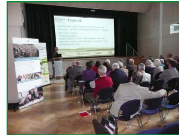
Regionaltag in Stockach, Mai 2010