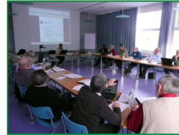
Seminar in Bad Urach, Februar 2010