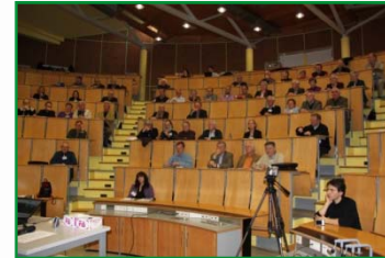
Auftaktveranstaltung in Ulm, März 2010