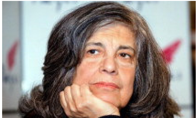
Ein Ring in Neu-Ulm für Susan Sontag.

52 Straßennamen sind in Ulm und Neu-Ulm nach berühmten sowie in Vergessenheit geratenen Frauen benannt. Ihre Geschichten gibt es jetzt als Buch - dank eines Zawiw-Arbeitskreises von zwölf Frauen.