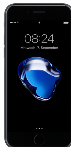
Apple iPhone 7

Die beiden Flaggships, die beiden besten Smartphones, die es auf dem Markt gibt, wollen wir ebenfalls kurz nennen und vorstellen, auch wenn wir für diese teuren Geräte nicht wirklich eine Kaufempfehlung aussprechen wollen. Sie sind einfach zu neu und zu teuer und enthalten Technik, die nicht wirklich im Alltag benötigt wird.